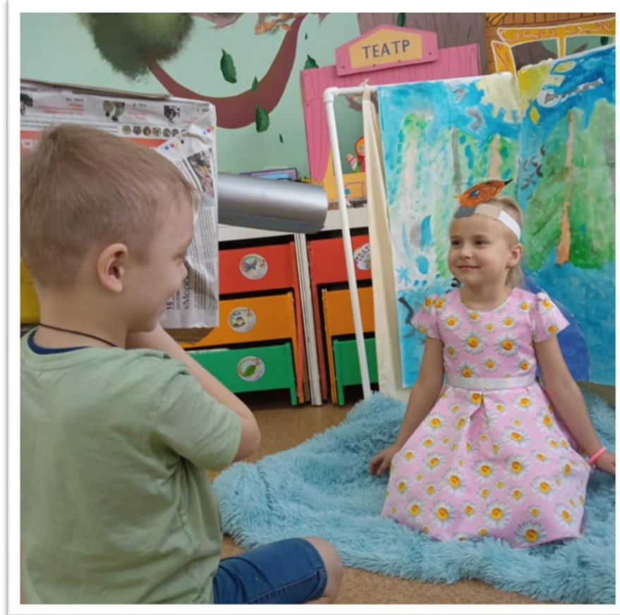
Сюжетно-ролевая игра «Фотоателье»