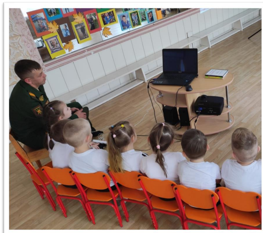
Рассказ о профессиональной деятельности