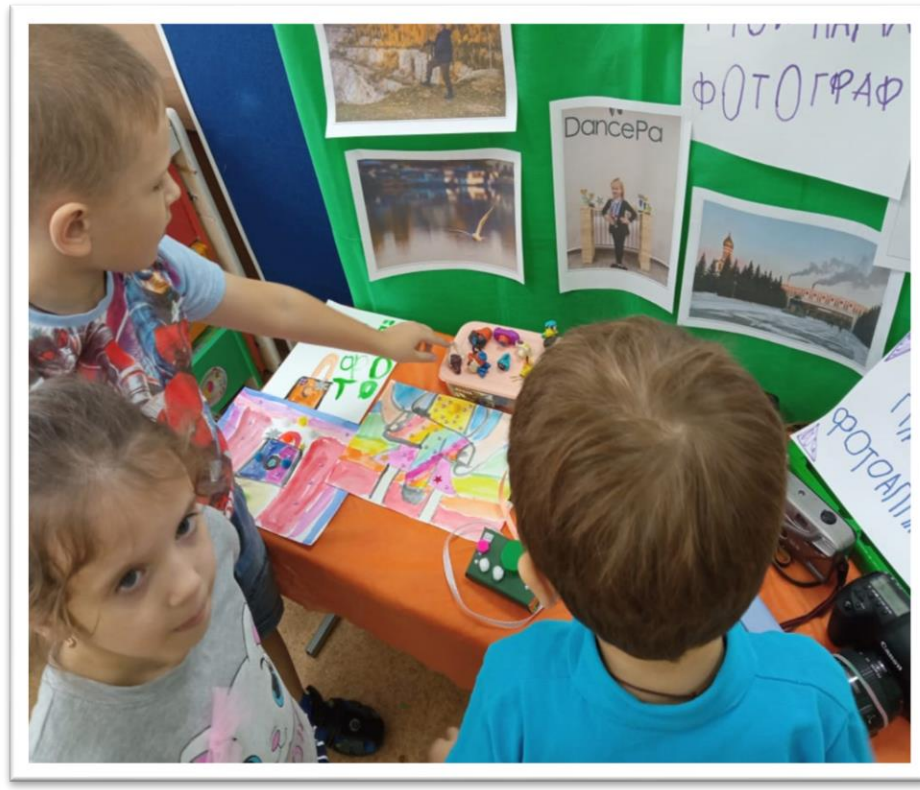
Выставка «Мой папа- фотограф»