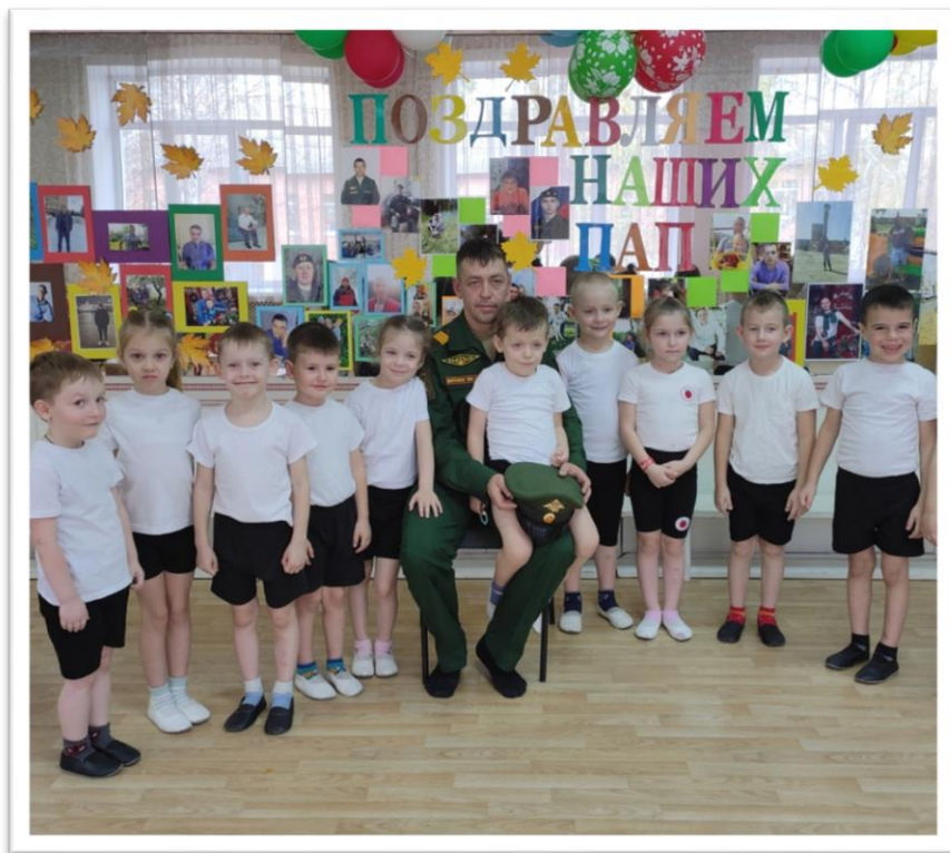
Встреча с интересным человеком