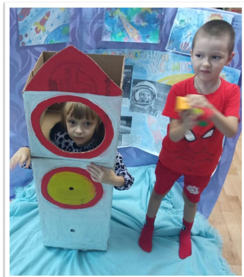
Игра «Полет в космос»