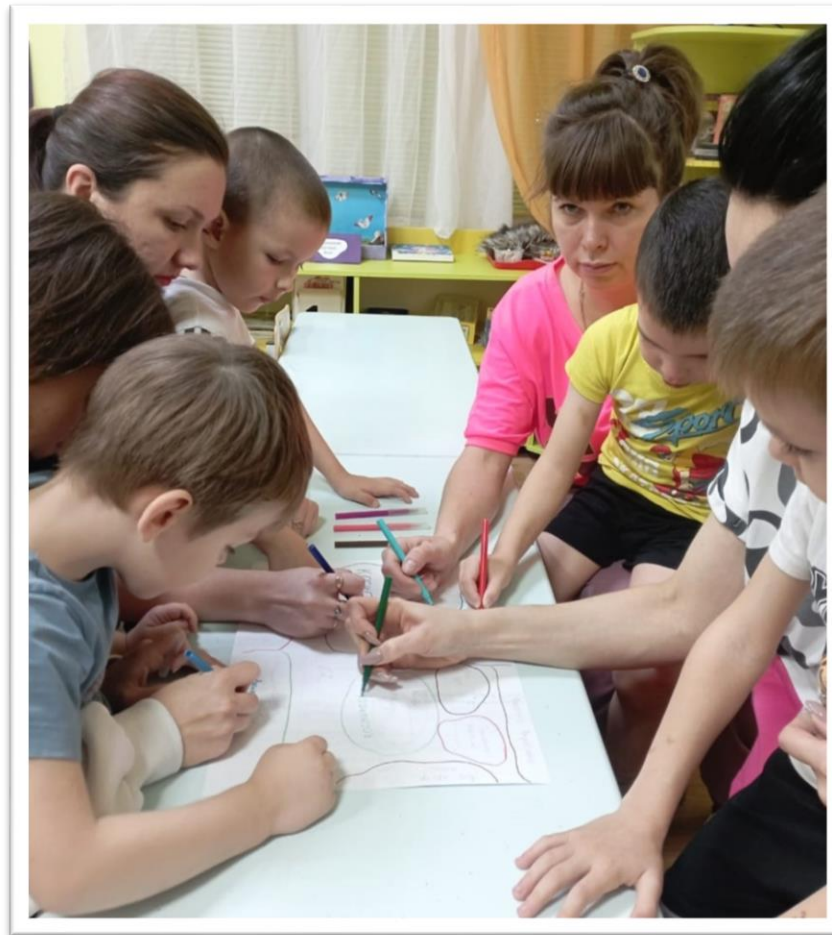
План преобразования среды группы