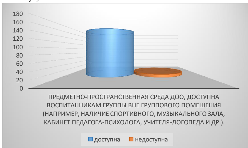
Рисунок 15. Предметно-пространственная среда ДОО, доступна воспитанникам группы вне группового помещения (например, наличие спортивного, музыкального зала, кабинет педагога-психолога, учителя-логопеда и др.).

Индикатор 3.2.9. Предметно-пространственная среда ДОО, доступна воспитанникам группы вне группового помещения (например, наличие спортивного, музыкального зала, кабинет педагога-психолога, учителя-логопеда и др.).