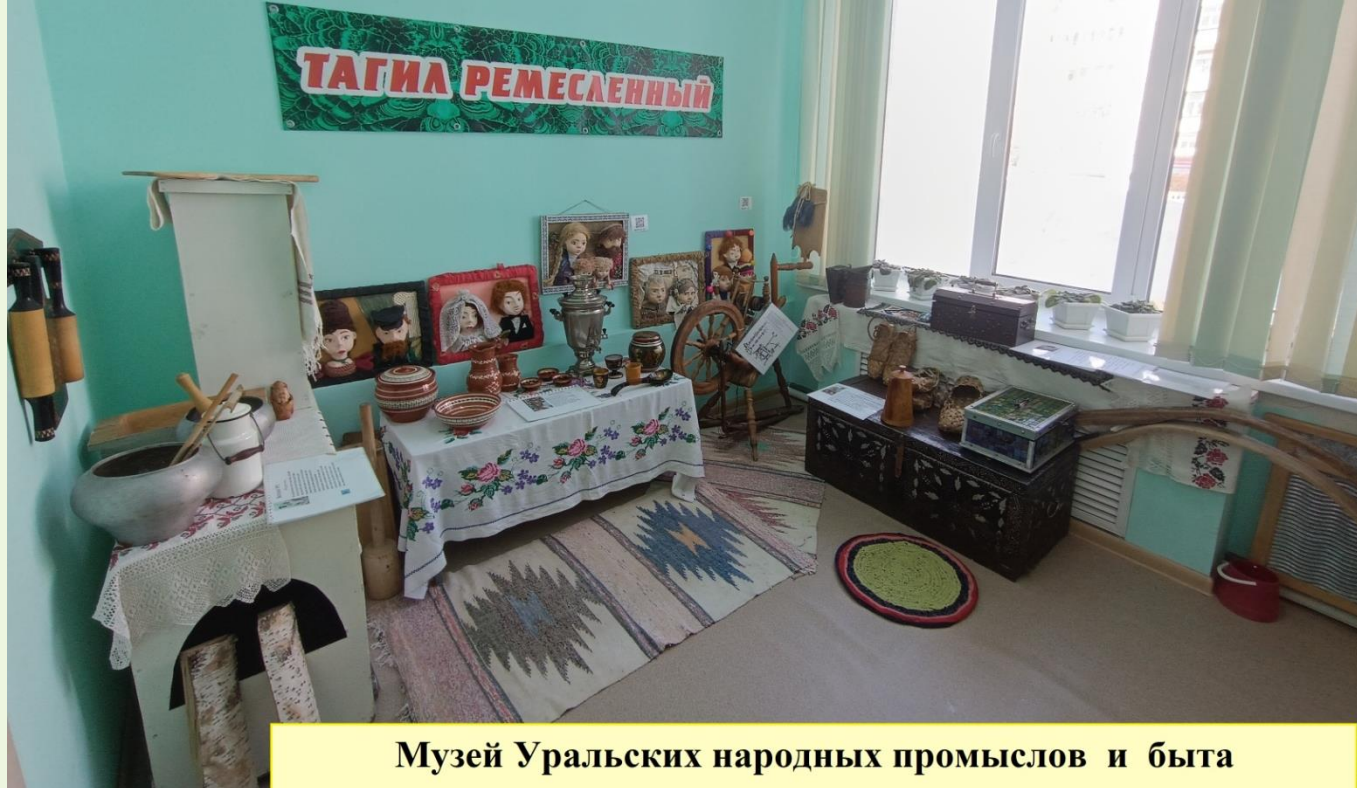
Музей Уральских народных промыслов и быта