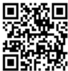
ЭКСПОНАТ № 1