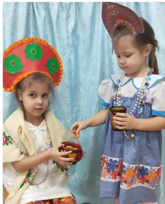
Мини-сценка «В гостях у бабушки Агафьи»