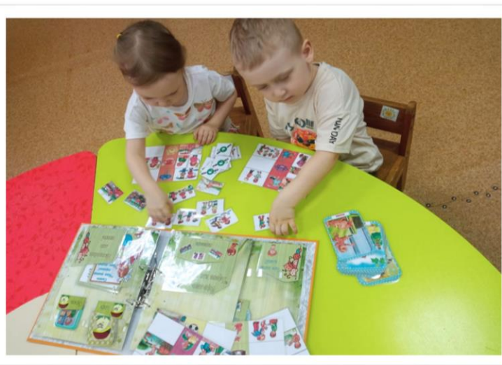
Лепбук «Что такое дружба?»