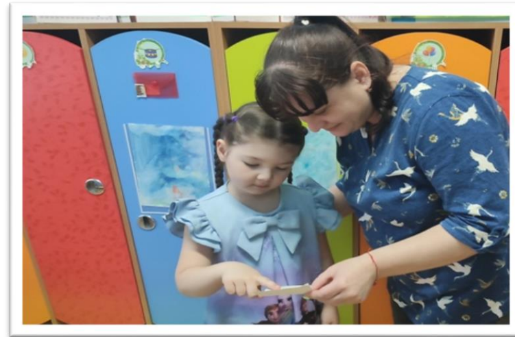
Конвертик «Мои добрые дела»