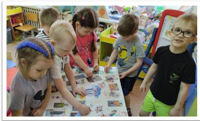
Газета «Наши добрые дела»