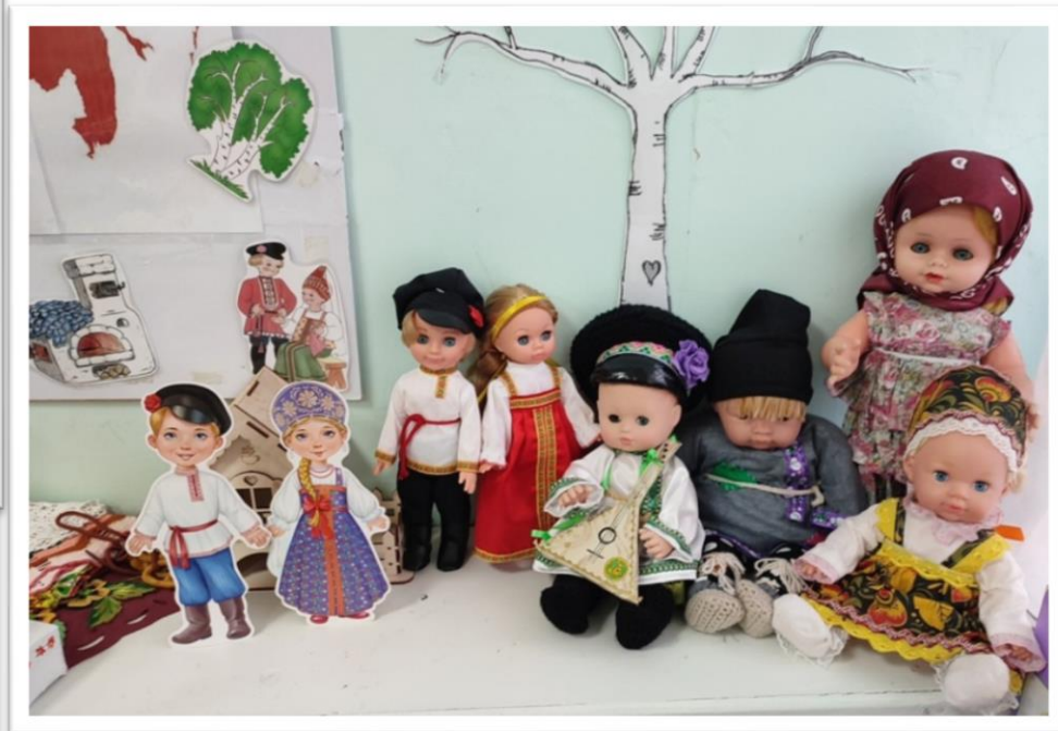
Выставка кукол в национальных костюмах