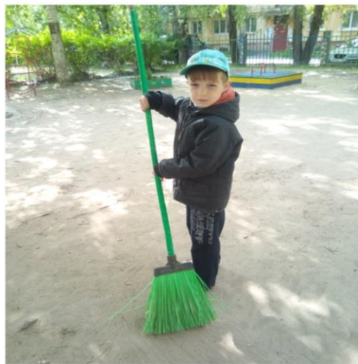
Субботники «Наведем порядок в группе», «Поможем дворнику»