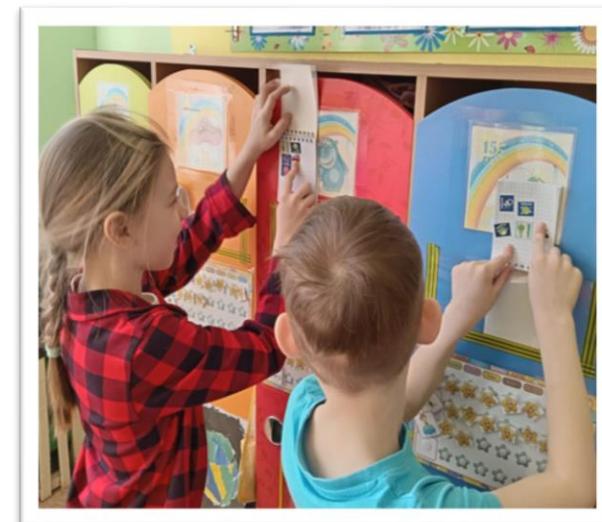
«Календарь добрых дел»