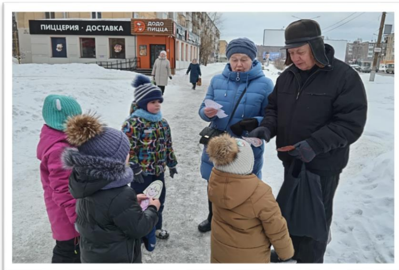
Акция «День добрых дел»