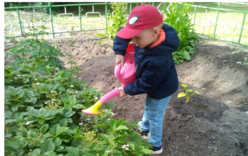
Коллективная трудовая деятельность